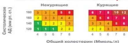
Рисунок 1. Шкала SCORE для определения риска смерти от сердечно-сосудистого заболевания в ближайшие 10 лет и шкала относительного риска.